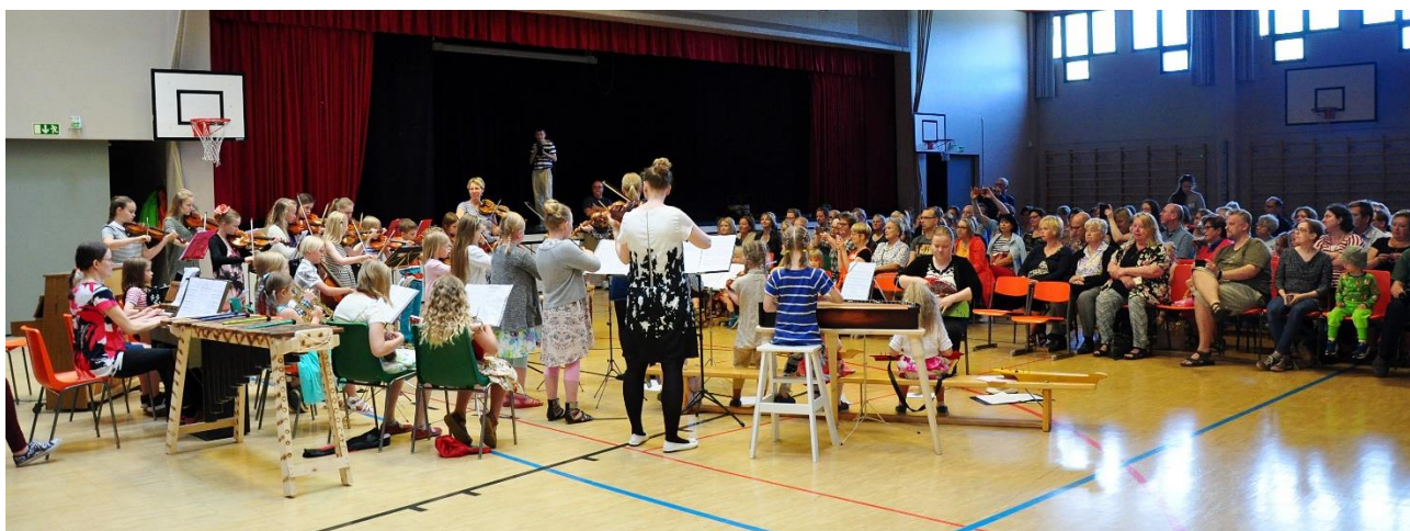
KUVA: Sommelossa on myös musiikin koulutusta. Kuva Näppärikurssin konsertista.