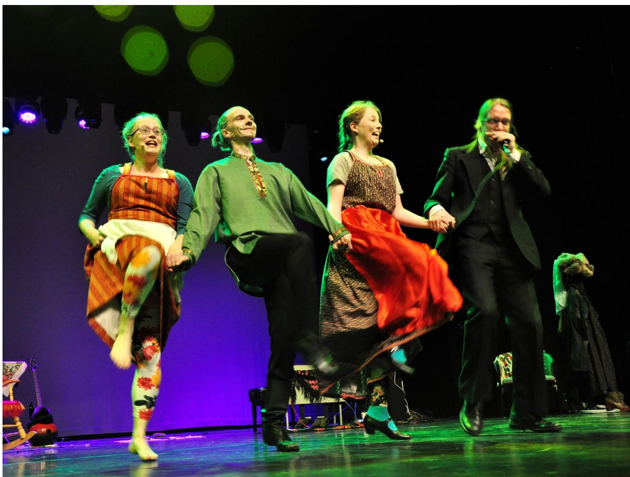
KUVA: Sommelossa on joskus ilo ylimmillään.