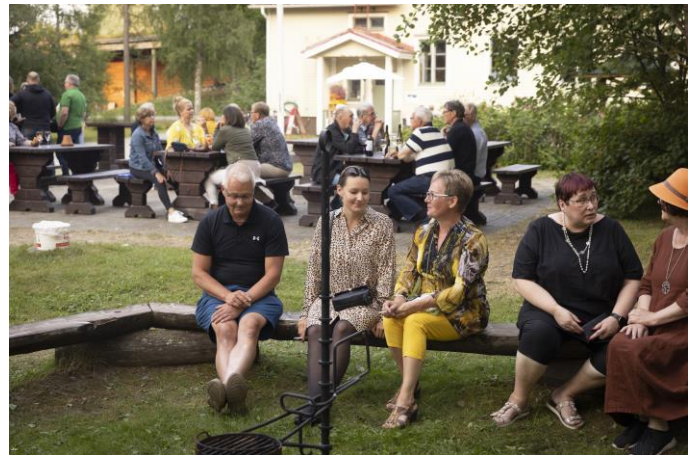
KUVAT: Juminkeko (vasemmalla) palvelee kesällä ja talvella. Kamarimusiikki on yksi kesän kohokodista.